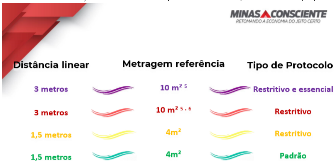
TABELA 1 – Recomendações de distanciamento (MINAS CONSCIENTE, versão 3.3 de 03/03/2021)