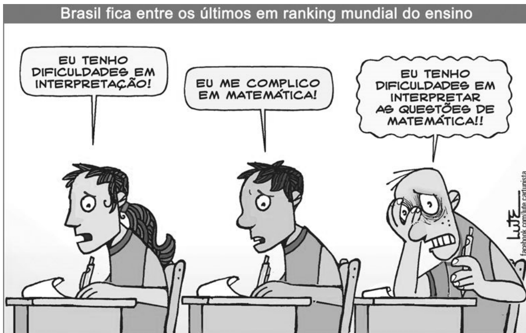
Disponível em www.facebook.com/lute.cartunista

Adaptado de CAFARDO, R. Brasil só deve dominar leitura em 260 anos. Folha de Londrina . Folha Geral. 1 de mar. 2018, p. 8.